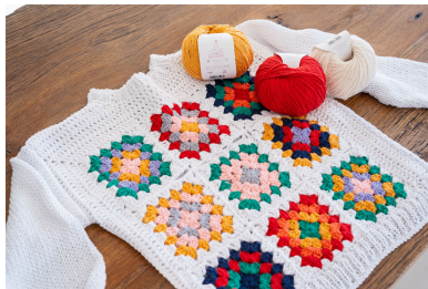
Schema 2: unione dei motivi, bordo e spalla